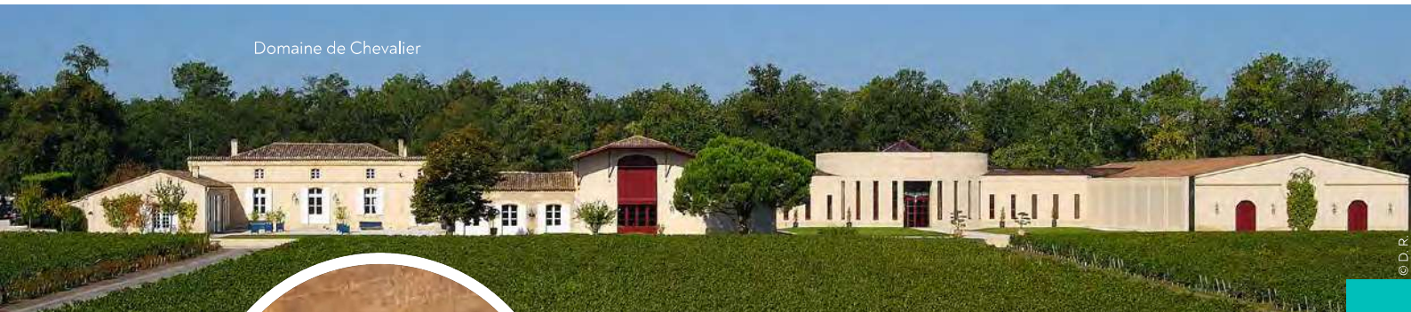
Domaine de Chevalier